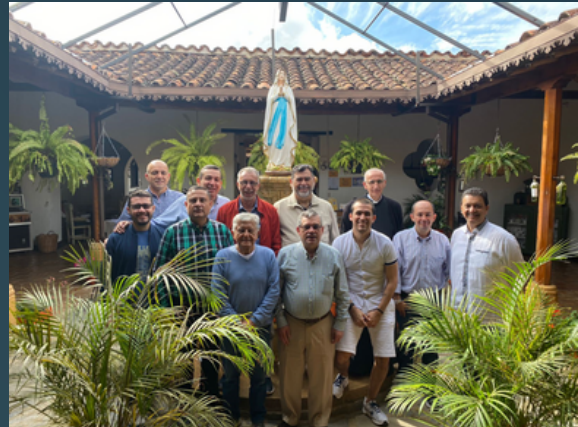
Familias sólidas: Los padres de familia se reúnen para hablar temas relacionados con su entorno.