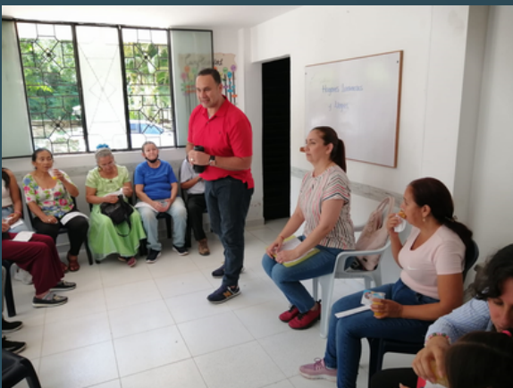
Charlas para familias del Barrio Cristal Bajo.