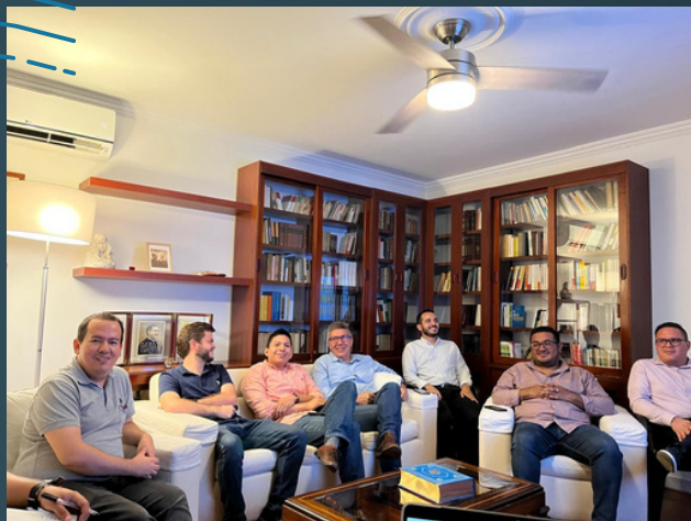
Cursos básicos y convivencias