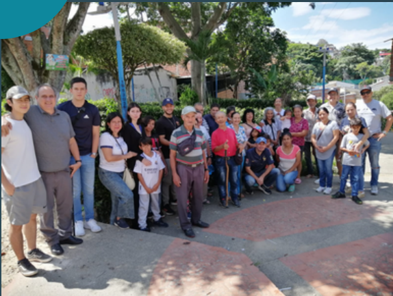
Entrega de mercados en el Barrio Zapamanga